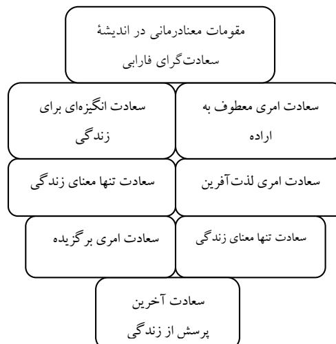
جدول ۳: یافته‌های پژوهش (نگارنده: براز)

• اگر در اندیشهٔ فارابی سعادت را انگیزهٔ زندگی محسوب کنیم که با آن زندگی معنا خواهد گرفت، ایدهٔ سعادت‌گرایی روشی معنادرمانی است که با کسب آن، انسان در تمامی ابعاد در کامل‌ترین وضعیت قرار می‌گیرد که نشانهٔ آن آرامش در زندگی و موجب تعاون و همکاری در اجتماع، عمل به وظایف سیاسی و اخلاقی و کسب کمال